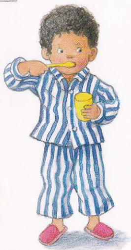
să mă spăl pe dinți