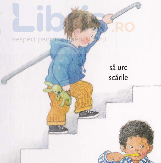
să urc scările