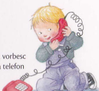
să vorbesc la telefon