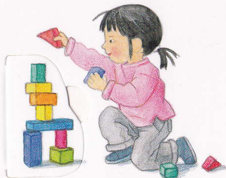
să construiesc turnuri

Tot ce poți să faci, ai învățat exersând: mai întâi să mergi de-a bușilea, apoi să fugi; mai întâi să gângurești, apoi să vorbești. Jucându-te, înveți în fiecare zi ceva nou.